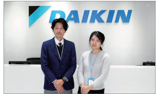
大金（中国）投资有限公司